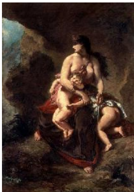
10. Ežen Delacroix, Medeja , 1862. Vrhunac njegovog umetni kog stvaralaštva je monumentalna kompozicija Medeja, koja ujedinjuje istotu forme i dubinu psihološke studije, izazivaju i saose anje kroz intenzitet i sklad kolorita.