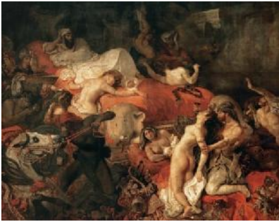
6. Ežen Delacroix, Smrt Sardanapala , 1827/28. Inspirisan engleskom literaturom, Lordom Bajronom, stvara prikaz najnižih ljudskih strasti i dominacije materijalnog u društvu.