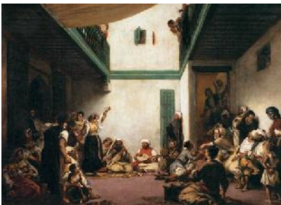
9. Ežen Delacroix, Jevrejska svadba u Maroku , oko 1841. Delo tako e pripada njegovoj fazi orijentalizma. Ežen ovo delo radi po brojnim skicama koje je na inio tokom svog egzotnog putovanja.