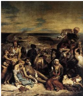
3. Ežen Delakroa, Masakr na Hiosu , 1824.

Slika inspirisana Danteom, kojom je prvi put primljen na Salon. Delo je inspirisano Žerikoovim delom Splav Meduze . Loša kritika nije umanjila veli inu njegovog uspeha.