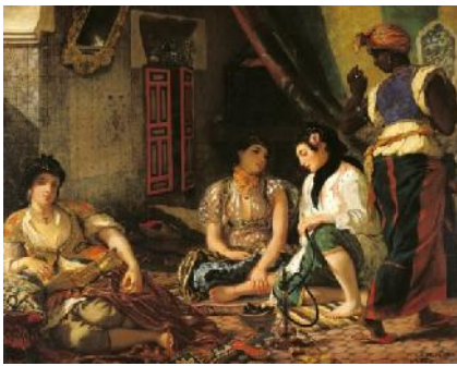
8. Ežen Delacroix, Alžirske žene u haremu , 1834. 1832. godine u estvuje u diplomatskoj misiji u Severnoj Africi. Ovo putovanje ga upoznaje sa novom kulturom koju e pokušati da do ara na svojim slikama. Ovaj period obuhvata njegovu orijentalisti ku fazu.