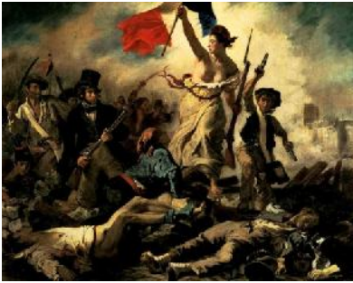
7. Ežen Delacroix, 28. Jul 1830 , 1831. Prisustvo u borbama Julske revolucije inspiriše Ežena na stvaranje kapitalnog dela koje izlaže na Salonu. Ova slika postaje simbol francuske nacije.