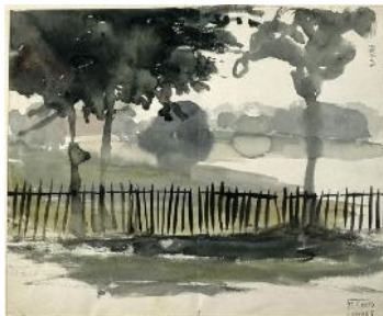
4. Ežen Delakroa, Pejzaži iz Engleske , 1825.

Predstavljena na Salonu, ova slika predstavlja vojni napad na stanovnike Hiosa od strane Osmanskog carstva.