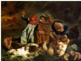
2. Ežen Delakroa, Dante i Vergilije u Paklu , 1822.

Ferdinand Viktor Ežen Delakroa, ro en 26. aprila 1798. godine. "Princ romanti ara" je umro 1863. godine u Parizu.