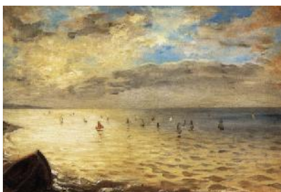
5. Ežen Delakroa, Morski pejzaži , oko 1855.

Tromese ni boravak u Engleskoj i uticaj Konstejbla i Boningtona ogleda se na Eženovim pejzažima.