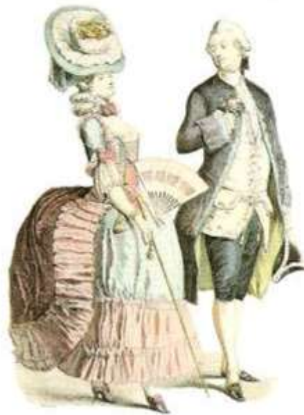
Ein Bewerber mit Rosen in der Hand betrachtet schmachmend eine Dame,

Den Fächer durch die Hand ziehen: „Ich hasse dich!“