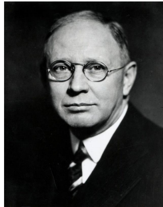
Clark Hull (1884-1952)