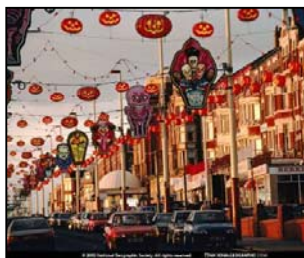
украси, зграде, стубови, аутомобили, опажају се као једнаки