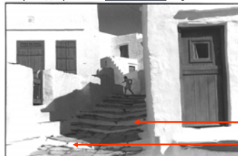
камење се опажа као бело , и на сунцу и у сенци